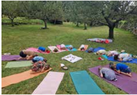
Kinderyoga - Pakima