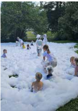
Blaulichtorganisation - Feuerwehr