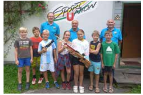
Schnuppertraining - Schützenverein