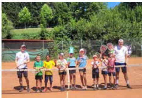
Schnuppertraining - Tennisverein UTC Kirchberg