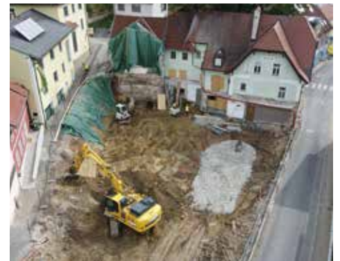
Hier entsteht die Baugrube