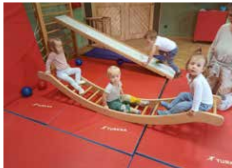
Spiel und Spaß im Turnsaal

Im Kindernest haben wir jeden Tag eine gemeinsame Jause, man spürt wie die Kinder die gemeinsame Zeit bei Tisch genießen.