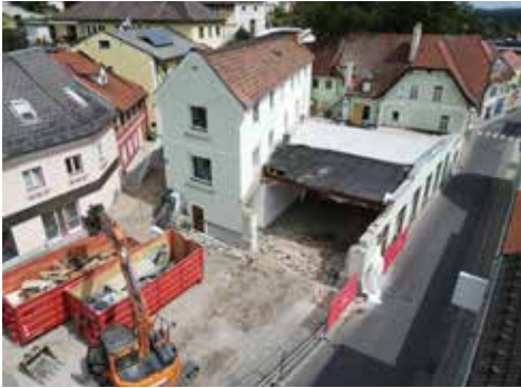
Der Abbruch beginnt

Aufgrund einer Reihe von Schwierigkeiten musste der Start der Arbeiten für den Neubau des Lindensaals mehrfach verschoben werden.