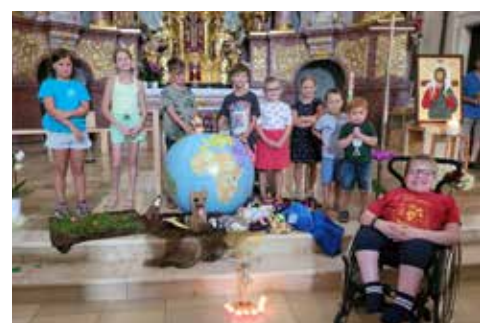
„Die Erschaffung der Welt“ - Pfarre und Pfarrbibliothek