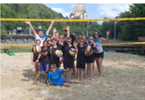
Beachvolleyball - Volleyballverein „Wuchtelklatzcher“