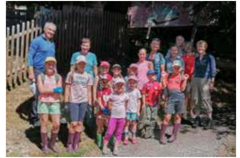
Abenteurer Kirchgraben - Ski- und Sportunion