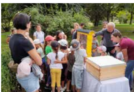
Blüte-Nektar(Pollen)-Honig - Imkerverein Kirchberg