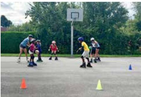
Spiel & Spaß mit Inlineskates - ULV Kirchberg