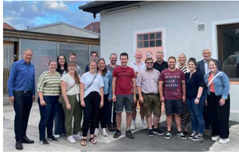
Am 3. Juli 2024 wurde das Landjugendheim in der Postgarage an die Landjugend Kirchberg am Wechsel übergeben.