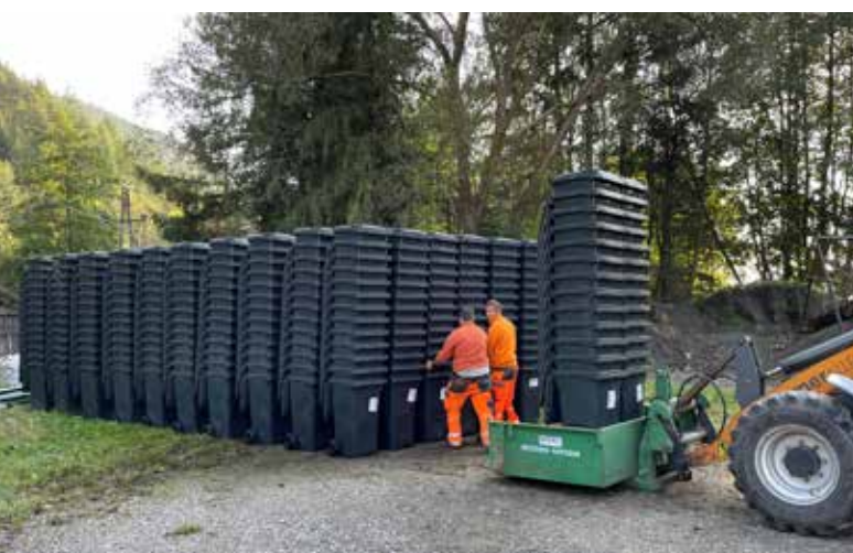
Die Restmülltonnen für die Wechsellandgemeinden wurden zentral bestellt und geliefert - ein Zeichen für die gute Zusammenarbeit.