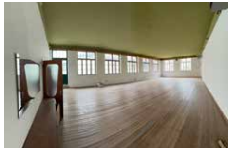
Der alte Lindensaal