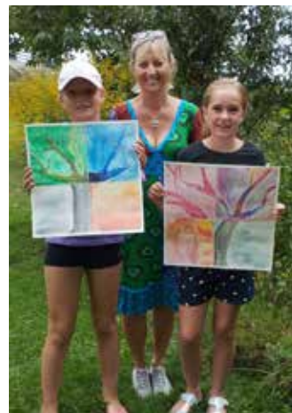
Wandern und Zeichnen - Sport Art&More