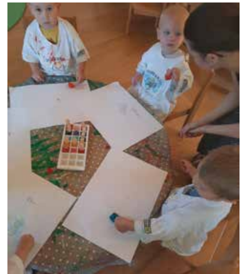
Mit eingefärbten Eiswürfeln malen