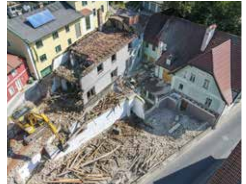
Einige Dächer waren aus Holz

onalität und dem enormen Einsatz aller beteiligten Personen wird der Bau gelingen.