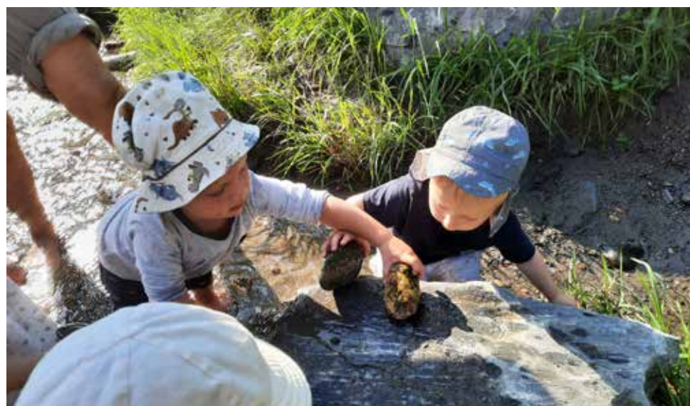
Badebucht in Kirchberg erkunden