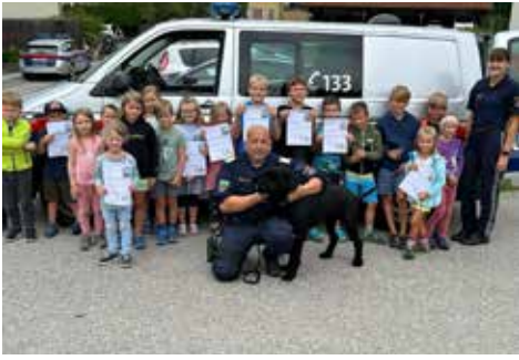
Blaulichtorganisation - Polizei