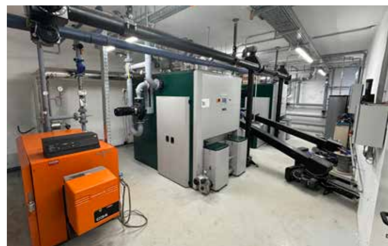
Am 17. September 2024 wurde das neue Heizwerk in der Volksschule in Betrieb genommen.