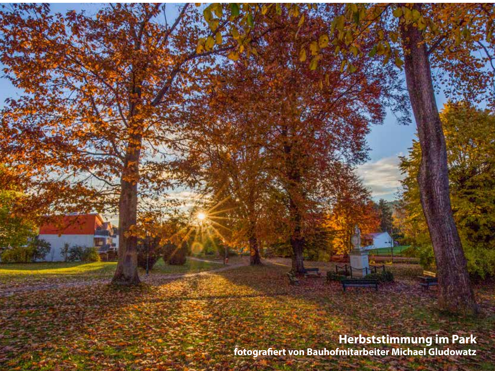
Herbststimmung im Park