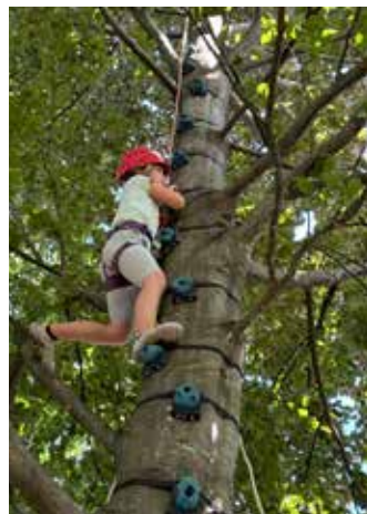
Baumklettern - Bergrettung