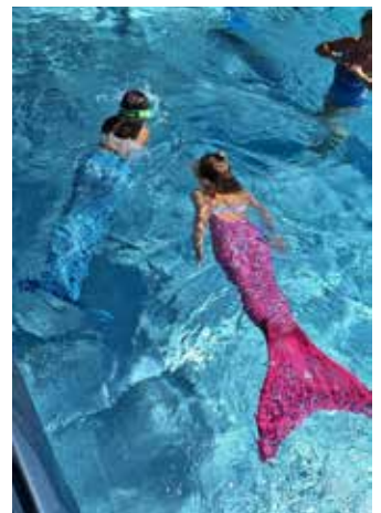
Meerjungfrauenschwimmen - Pakima