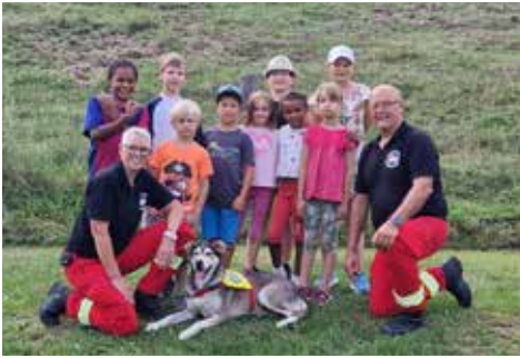
Richtiger Umgang mit Hunden - HundeSportFreunde