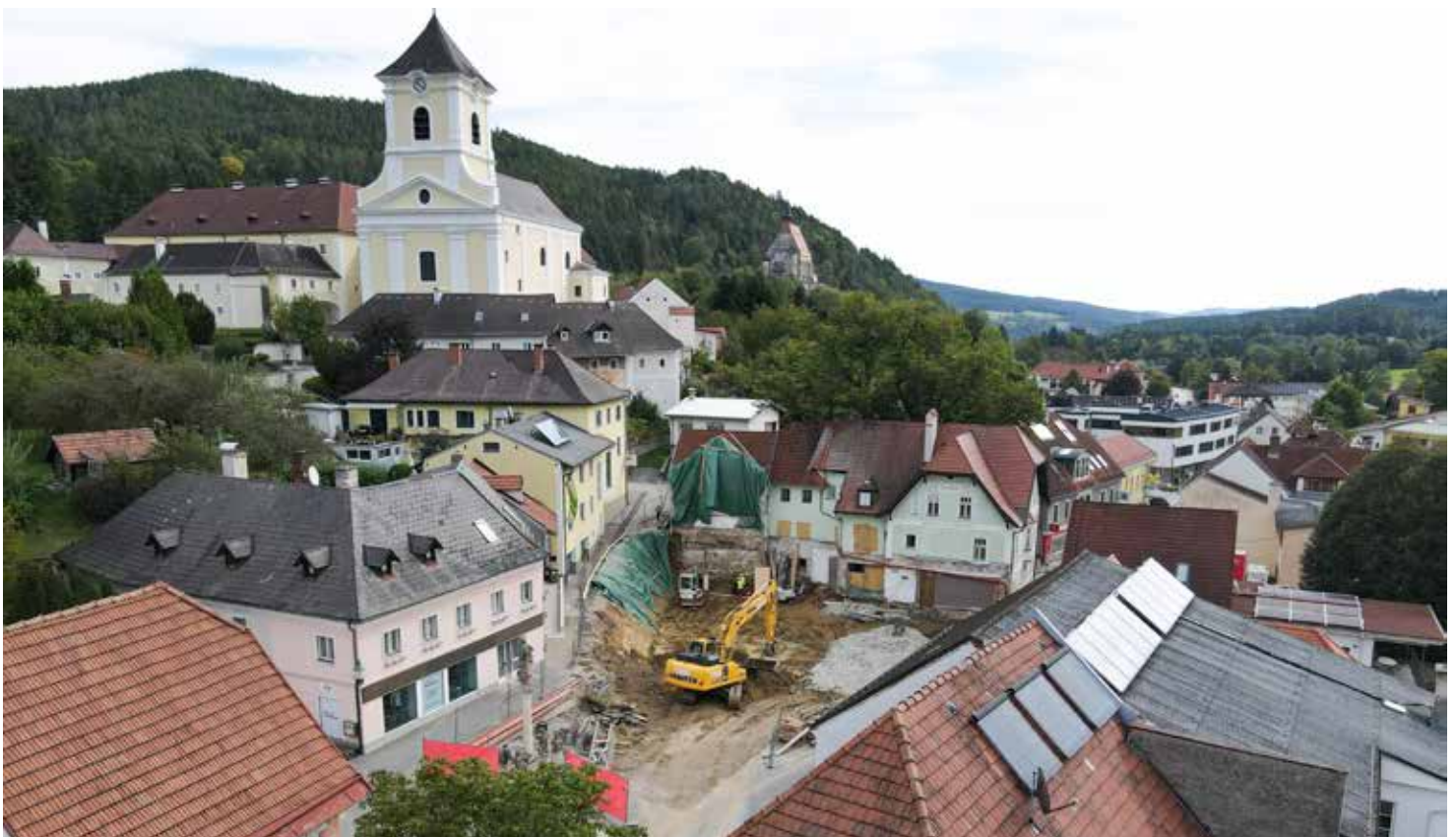
Diese Aufnahme zeigt die Größe der Baustelle