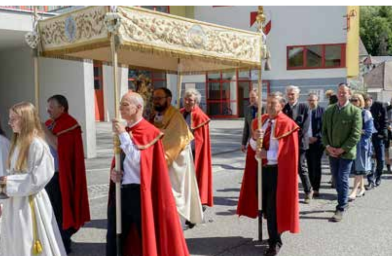
Die Fronleichnamsprozession führte traditionell durch den Ortskern.