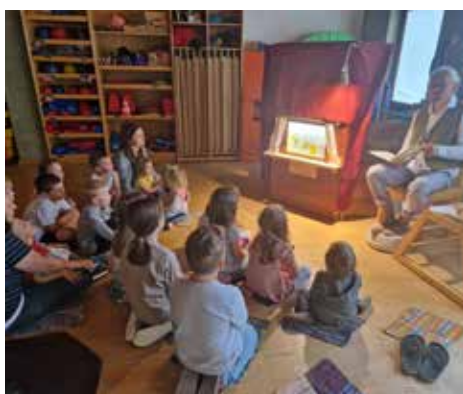
Bei der Theateraufführung hörten die Kinder neugierig zu.

Im Ausklang des Theaters hatten die Kinder die Möglichkeit, ein Bild mit verschiedensten Materialien zu legen. In dieser stimmungsvollen Atmosphäre entstanden wunderschöne Kunstwerke.