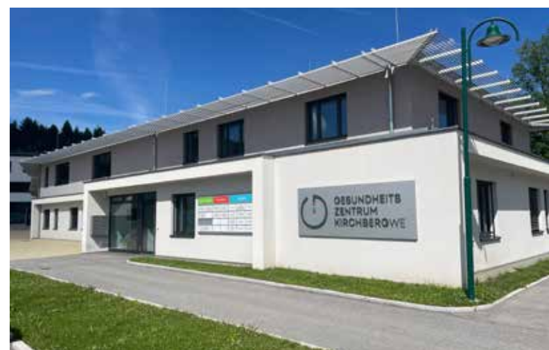
Vorankündigung: Am Samstag, 14. September 2024 findet im Gesundheitszentrum ein Tag der offenen Tür statt.