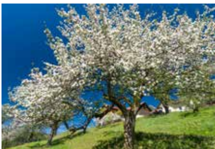
Apfelbaum in voller Blüte

Aufgrund der großen Nachfrage und des Erfolgs der letzten Jahre führt die KLAR! Region Bucklige Welt - Wechselland in Zusammenarbeit mit dem Bildungszentrum Warth und dem Niederösterreichischen Landschaftsfonds wieder eine Obstbaumpflanzaktion für das südliche Niederösterreich durch.