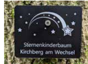
Namensschild am Sternenkinderbaum Klosterwald Kirchberg am Wechsel

Mehr über den Klosterwald erfahren Sie auf www.klosterwald.at , per E-Mail an presse@klosterwald.at oder telefonisch 02243/23660.