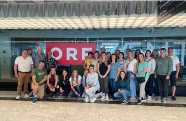
Der Betriebsausflug der Gemeinde führte ins ORF-Zentrum und anschließend zum Heurigen.