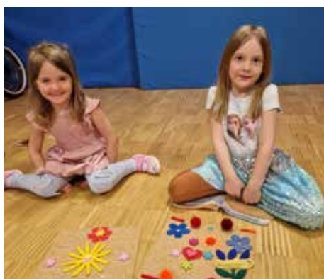
Die Kinder bei der Gestaltung von Bildern.

Es geht hierbei um die Selbsterfahrung und Spaß an der Bewegung. Weiters fördert Yoga die Konzentrationsfähigkeit, wirkt beruhigend und ausgleichend.