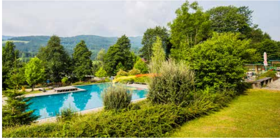
Das Kirchberger Freibad ist von sattem Grün eingerahmt.

Im Freibad wurden vor Beginn der Badsaison Instandhaltungs- und Sanierungsmaßnahmen durchgeführt, die ei-