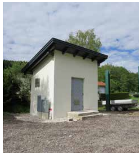
In diesem Technikgebäude (hinter der Tankstelle) ist die Anlage untergebracht.