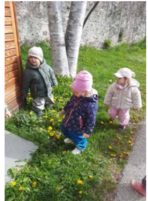
Nestkinder bei einem Spaziergang im Frühling.

Seit Februar konnten wir wieder viele „kleine neue Nestkinder“ im Kindernest begrüßen und wir freuen uns sehr, dass sie da sind – herzlich willkommen!