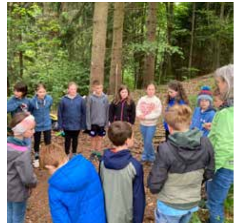
Die Schüler:innen beim Sammeln von Waldschätzen.