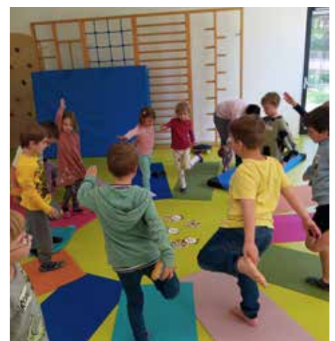
Die Kinder machen bei den Yogaübungen begeistert mit.