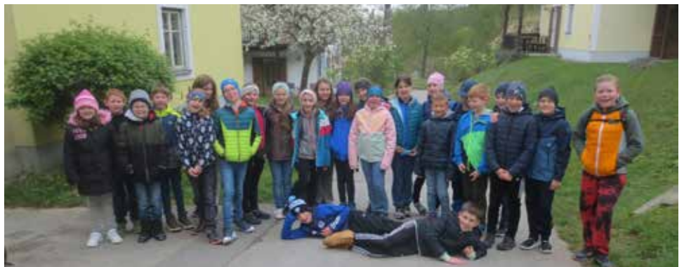
Die Schüler:innen der 4. Klassen.

Diese Projekttag werden uns mit Sicherheit noch länger ein Lächeln ins Gesicht zaubern.