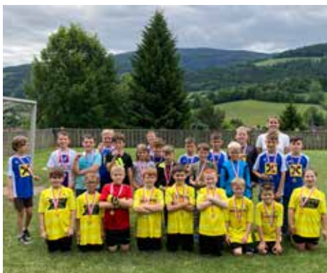
Die Mannschaft der Volksschule Kirchberg am Wechsel.

Am 29. Mai 2024 fand auch heuer wieder das traditionelle Fußballturnier des Feistritztales auf unserer Schulwiese statt.