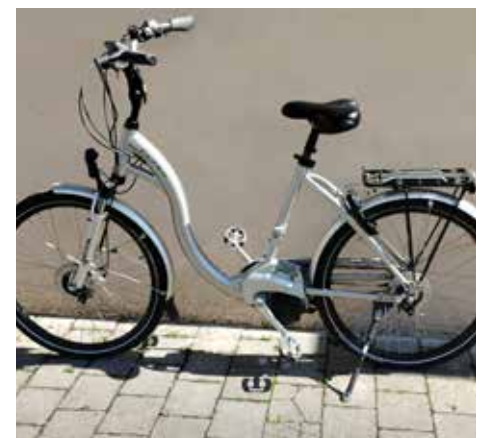
Vom Tourismusverein werden diese 4 E-Bikes verkauft.