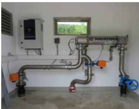
Die neue UV-Anlage ist seit 18. April 2024 in Betrieb.

Damit entspricht die Goldbergquelle dem letzten Stand der Technik und wird uns weitere Jahrzehnte mit einwandfreiem Trinkwasser beliefern.