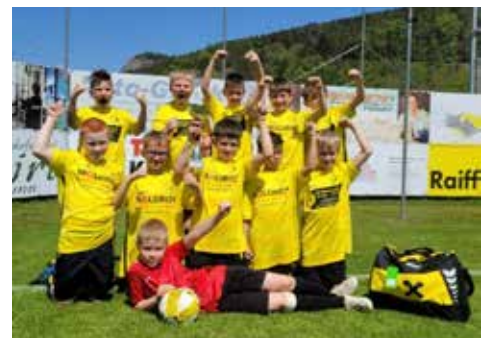
Die stolzen Zweitplatzierten.

Trotzdem freuten wir uns richtig über den stolzen zweiten Platz und über die Chance, ein weiteres Turnier in Brunn am Gebirge zu spielen.