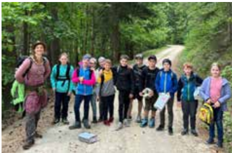
Die Waldpädagogin mit den Schüler:innen im Wald.

Von 13. bis 17. Mai fand die „Waldwoche“ statt.