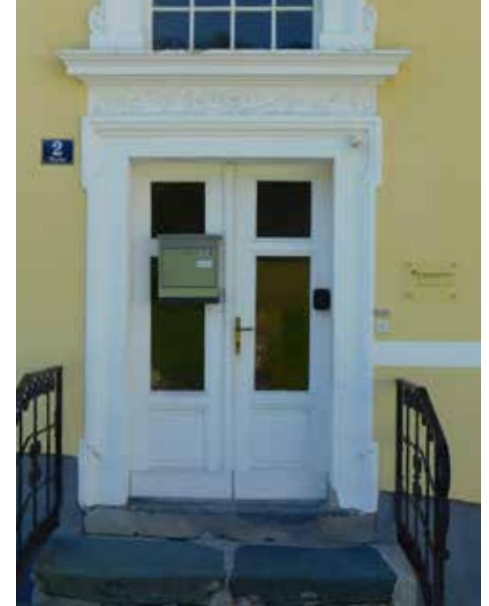
Der Praxiseingang beim Kloster.