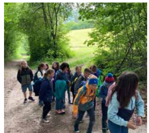
Die Schüler:innen am Weg zum 69-jährigen Mammutbaum.