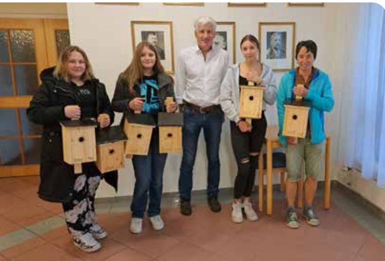
Die 4a der Mittelschule Kirchberg am Wechsel baute im Unterrichtsfach KREA (Kreatives Gestalten) Nistkästen. Diese wurden der Gemeinde übergeben und werden an Bäumen aufgehängt.