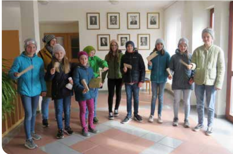
In der Karwoche statteten die Ratschenkinder der Gemeinde einen Besuch ab.