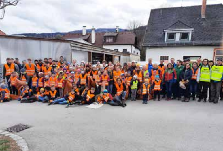
Flurreinigung am 25. März 2023. Dieses Jahr haben rund 125 Personen mitgeholfen. Vielen Dank für das Engagement!