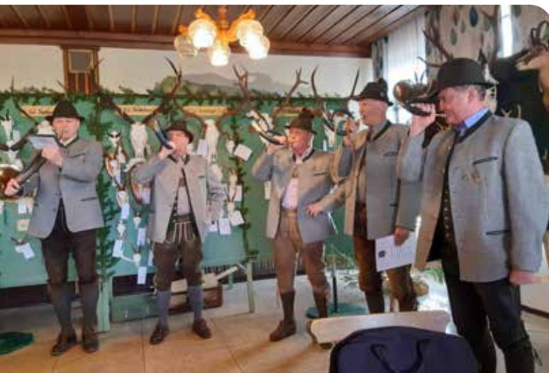
Am 19. März 2023 fand die Trophäenschau des Feistritztales im Gasthof Ödenhof statt.