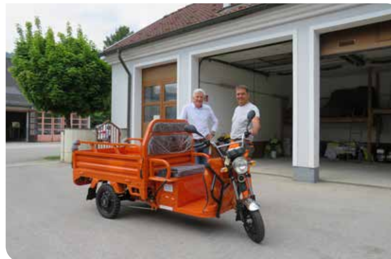
Der Gemeindefuhrpark wurde mit einem elektrischen Lastenrad erweitert, natürlich in leuchtorange!