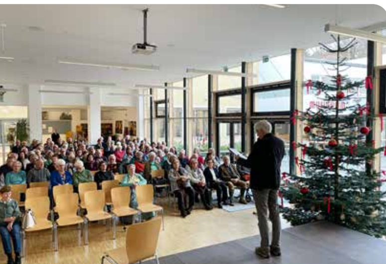
Am 7. Dezember 2022 hat die Gemeinde alle Senior:innen zu einer Adventfeier in die Mittelschule eingeladen.