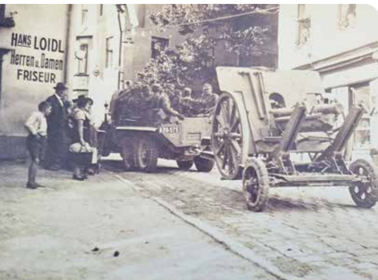
Links das Friseurgeschäft im Standort Markt 59, vis-à-vis vom Hotel 1000-jährige Linde.