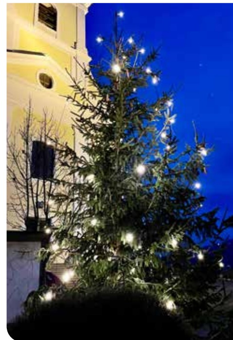
Christbaum beim Kriegerdenkmal