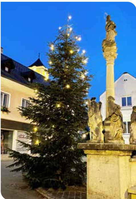
Christbaum am Hauptplatz

Die Marktgemeinde Kirchberg am Wechsel bedankt sich herzlich für die Christbaumspenden beim Erzbischöflichen Forstamt. Der Christbäume tragen zu einem schönen Ortsbild bei. An dieser Stelle möchten wir auch allen Gewerbebetrieben für ihre weihnachtliche Dekoration danken. Auch in vielen Privatgärten können beleuchtete Christbäume bewundert werden und stimmen auf Weihnachten ein.