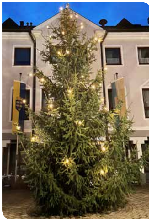
Christbaum vor dem Gemeindeamt