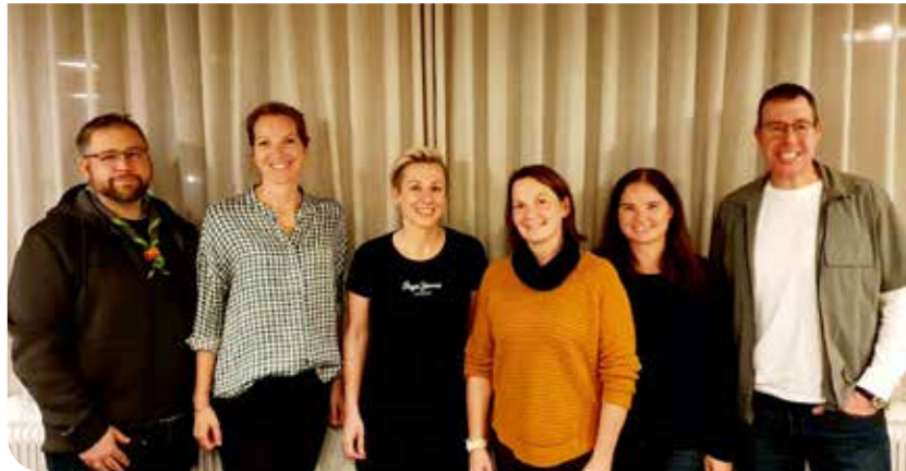
Der neugewählte Vorstand

Der Elternrat bildet Rahmen und Fundament dafür, dass in Kirchberg und im Feistritztal auch weiterhin hervorragende Kinder- und Jugendarbeit durch unsere Gruppenleiter:innen geleistet wird.