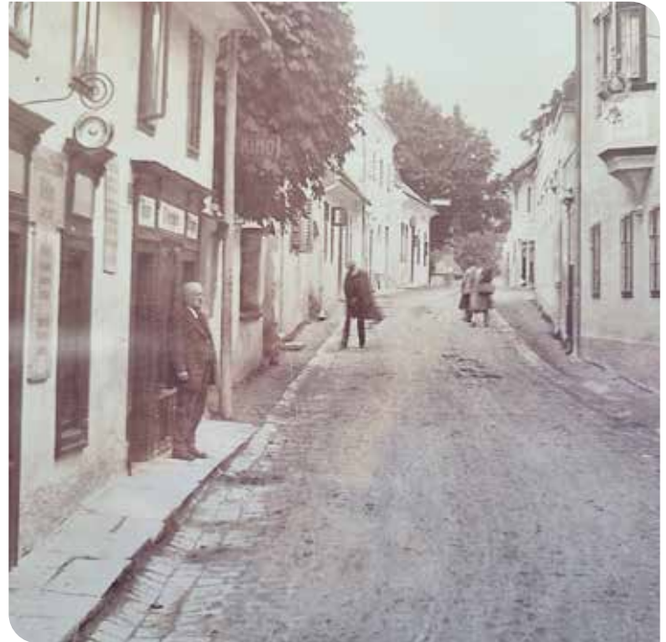
Die Straßenansicht des Geschäfts im Standort Markt 59.