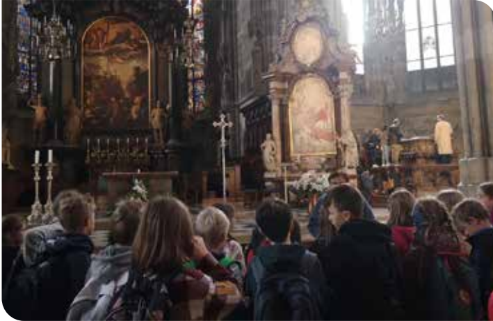
Innenansicht Stephansdom Wien

Den Abschluss unseres schönen Wientages verbrachten wir im Technischen Museum.