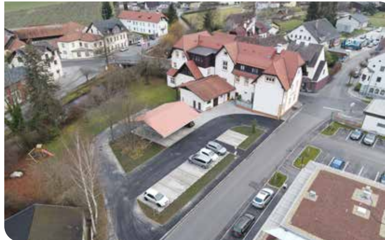
Flugaufnahme der fertiggestellten Außenanlage beim ehemaligen Hotel Post, angefertigt von Gemeindearbeiter Michael Gludowatz.