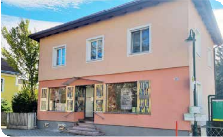
Markt 221, hier wurden beinahe 60 Jahre lang Haare geschnitten und Frisuren gemacht.