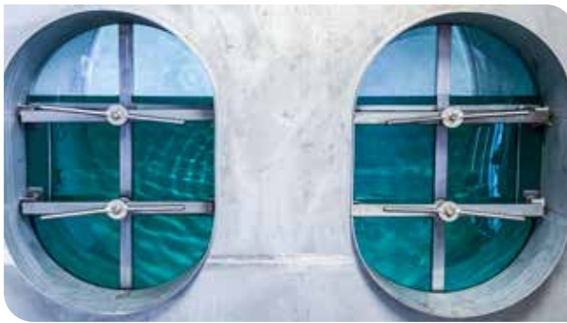
Trinkwasserbehälter - Wasserversorgungsanlage Friedersdorf

Die geplante Verlegung von Glasfaserkabeln ist der Anlassfall, dass noch vorher, weil tiefer liegend, die überalterten Wasserleitungen in den Siedlungen getauscht werden. Die Wiederherstellung (Asphaltierung) der Straße wird zwischen den beiden Vorhaben geteilt. In der Ramssiedlung wurde dies bereits im Herbst 2022 umgesetzt, die St. Wolfgangssiedlung und die Hofrat Schneider-Siedlung sind für das nächste Frühjahr geplant.