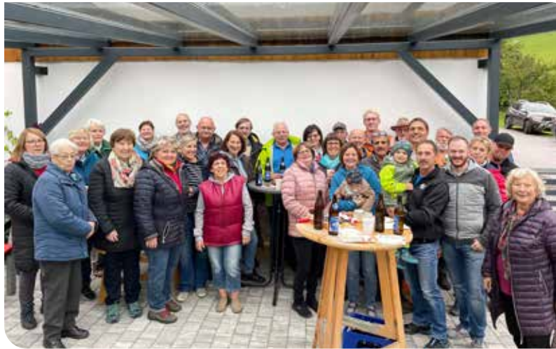
Nach Fertigstellung der Wasserleitung in der Ramssiedlung luden die Bewohner:innen zu einer Gleichenfeier ein.