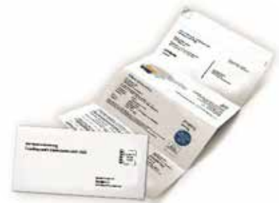
Amtliche Wahlinformation - NÖ Landtagswahl

Damit erleichtern Sie uns die Wahlabwicklung.