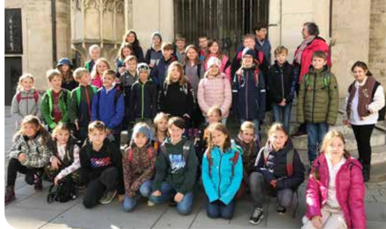
Die Schüler:innen beim Ausgang aus dem Dom