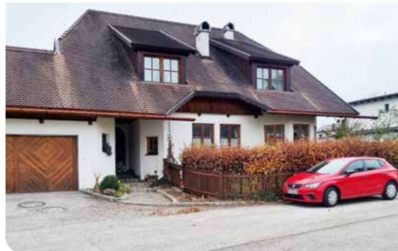
Ab Jänner 2023 freuen wir uns, Kund:innen in unserem Wohnhaus im Standort Markt 317 begrüßen zu dürfen.