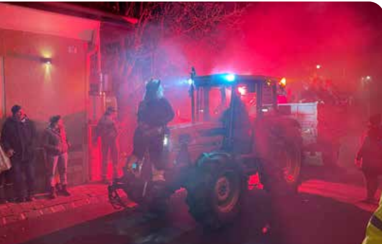
Am 5. Dezember durfte nach coronabedingter Pause der traditionelle Krampusumzug und Nikolo wieder stattfinden.