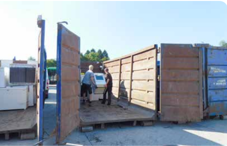
Heuer wurden 30 Sperrmüllcontainer mit Altstoffen befüllt, das sind 5 mehr als im Vorjahr.