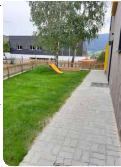
Unser Garten - Vielen Dank an die Gemeindeglieder für die Gestaltung und Fertigstellung des Gartens.

Es ist immer wieder ganz besonders und schön, wenn wir neue „Nestkinder“ in unsere Gemeinschaft aufnehmen dürfen.