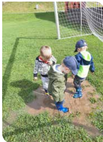
Auf der Volksschulwiese konnten wir uns austoben und „Lacken hüpfen“ macht riesengroßen Spaß...

Auch unser toller Garten entsteht gerade für die Kinder im Kindernest und wir freuen uns, wenn wir ihn im Herbst gemeinsam entdecken und genießen können.