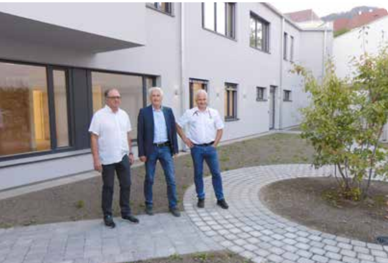
Die Innenansicht des Gesundheitszentrums kennen sicher erst wenige.