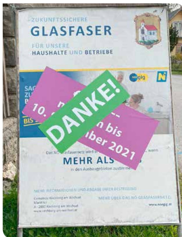
Kirchberg hat es geschafft!