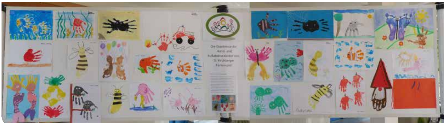
Die tollen Hand- und Fußabdruckbilder sind im Gemeindeamt ausgestellt und können noch bis 22. Oktober 2021 bewundert werden.