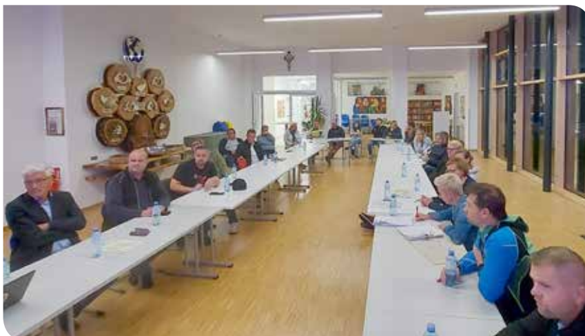
Eine Botschafterschulung in der Mittelschule.