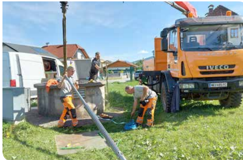
Die Trinkwasserpumpe beim Bauernwiesenbrunnen in Kirchberg ist, natürlich am Wochenende, kaputt gegangen. Durch tatkräftige Zusammenarbeit konnte am Wochenende eine Ersatzpumpe organisiert und eingebaut werden. Danke an alle Wasserbezieher für ihre Geduld und ihr Verständnis.