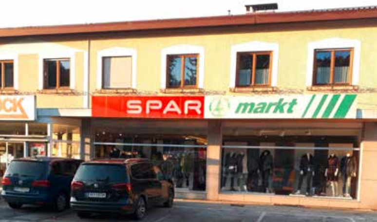
Ortsbild im Wandel. Der Sparmarkt Köck ist ein wesentlicher Bestandteil zur Stärkung unseres Ortskerns.