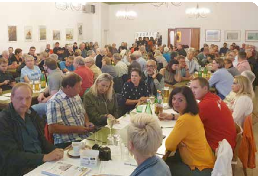
Die Infoveranstaltung wurde von zahlreichen Interessenten besucht.

Mit Ihrer Bestellung wird ein wichtiger Entwicklungsschritt für die Gemeinde und die Region gesetzt!