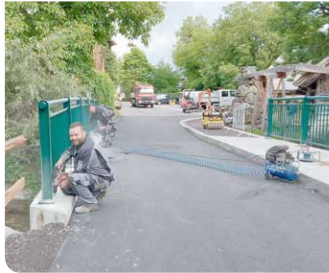
Die Schlosserei Fuchs montiert gerade das neue Geländer!

Vielen Dank an alle, die zum Gelingen dieses Werkes beigetragen haben!