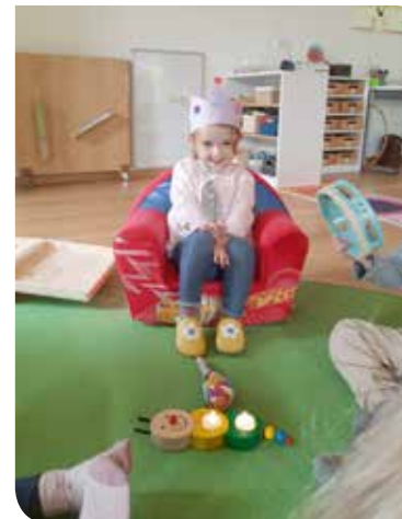
Geburtstag feiern im Kindernest – für die Kinder ein besonderes Ereignis...

Uns macht es viel Freude, die Entwicklungsschritte der Kinder begleiten und unterstützen zu dürfen. Jedes Kind braucht seine individuelle Zeit, um Neues zu erforschen, Vieles auszuprobieren und seine Fähigkeiten entdecken zu können - Schritt für Schritt, jedes Kind in seinem Tempo. Dabei möchten wir unsere „Nestkinder“ bestärken und ermutigen und ihnen die Welt so bunt und vielseitig wie nur möglich zeigen.